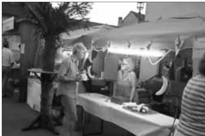
Bananenverkauf bei Dorffest

Im Kinderdorf in Kemondo ist vielen dadurch große Freude bereitet worden, da dieses wertvolle Geschenk von unseren Kindern wie auch unseren Arbeitern regelmäßig genutzt wird. Ohne existierenden Winter im Land ist das Netz am Wochenende wie auch abends nach Dienstschluss fast täglich im Gebrauch!