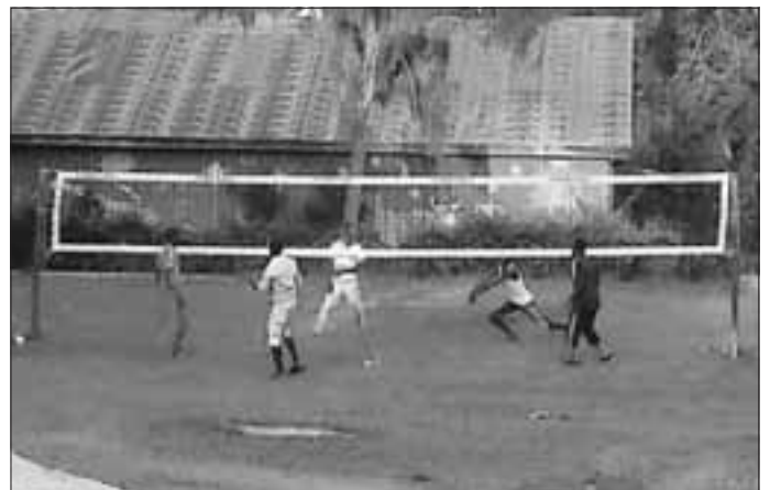
und im Betrieb

Vielen Dank im Namen unserer Kinder, unseres Managements und auch unserer Beschäftigten.