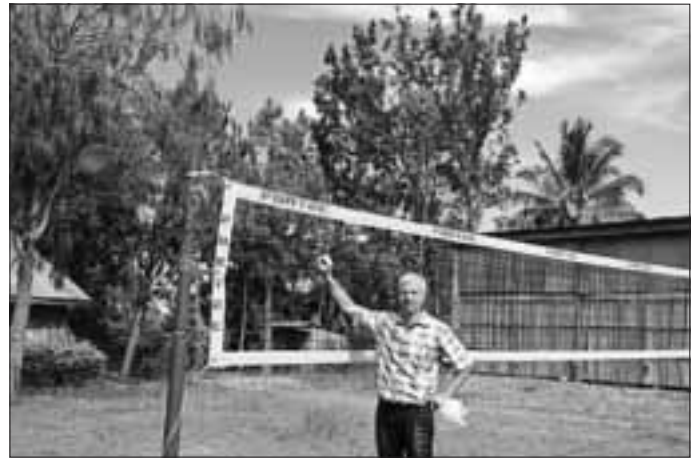
Das neu erworbene Netz