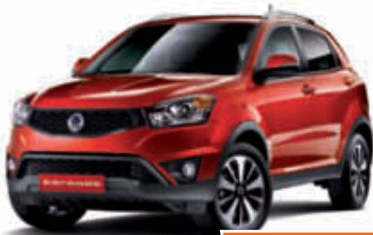
Abbildung zeigt kostenpflichtige Sonderausstattung