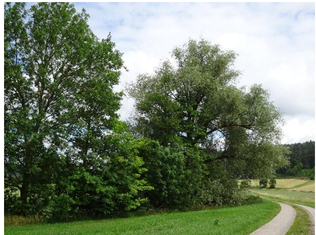
Abbildung 5: Ufergehölz an der Rezat