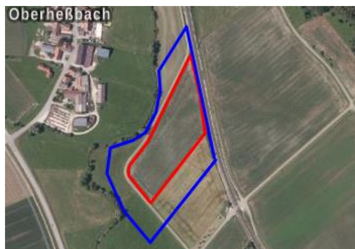
Abbildung 6: Planungsgebiet (rote Linie) und Untersuchungsgebiet (blaue Linie)