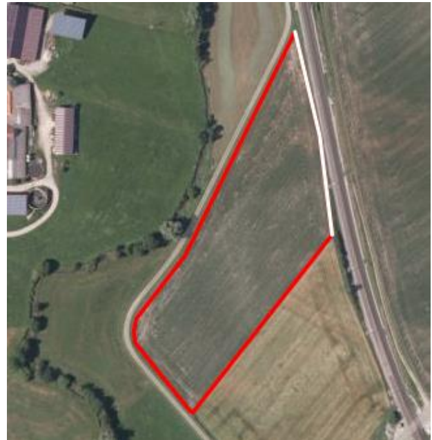
Abbildung 9: M06: weiße Linie: Pufferstreifen zur Bahnlinie, um eine Betroffenheit der Zauneidechse auszuschließen