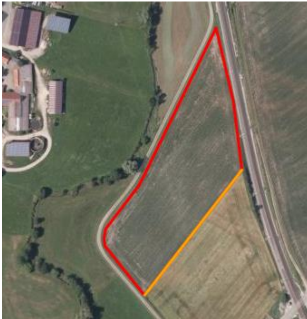
Abbildung 8: Empfehlung: orange Linie: wenn möglich keine Eingrünung, rote Linie: möglichst Eingrünung mit klein bleibenden Gehölzarten