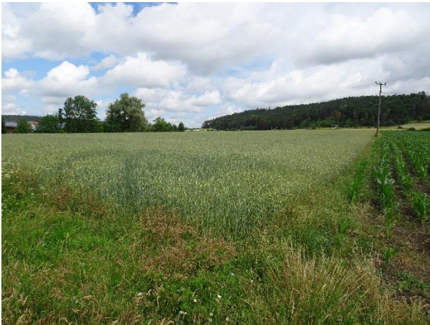
Abbildung 2: Das Planungsgebiet