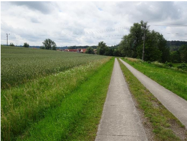
Abbildung 4: Nordwestlicher Randbereich