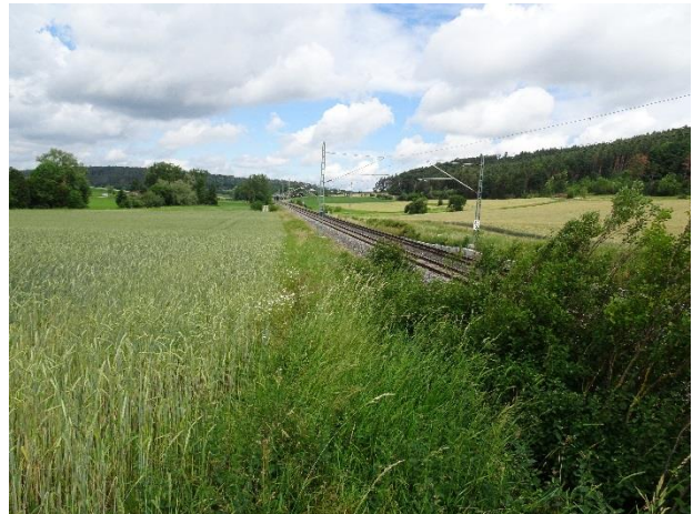
Abbildung 3: Entlang des Bahndamms