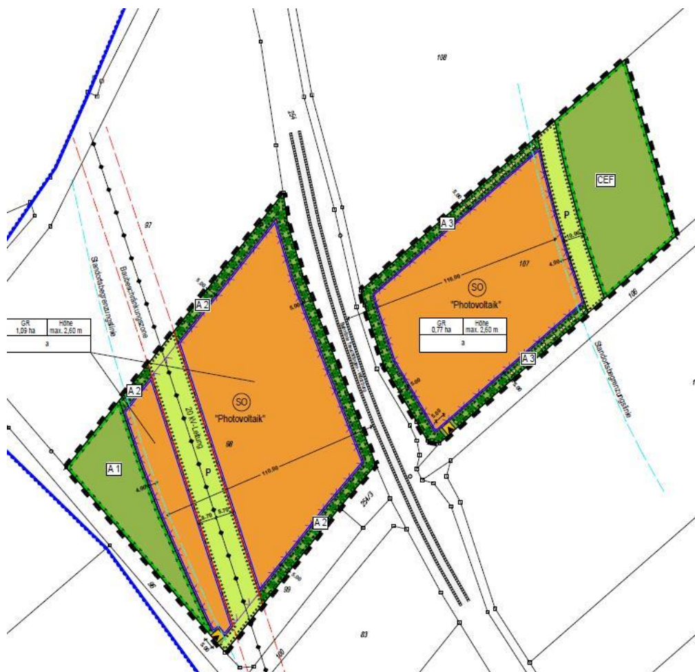
Abbildung 2: Geltungsbereich

Auf einer etwa 1,5 ha großen Fläche und einer etwa 2,3 ha großen Fläche zwischen Oberheßbach und Unterheßbach soll ein neuer Solarpark entstehen (siehe Abb. 1 und 2). Zwischen den beiden Teilflächen verläuft die Bahnstrecke. Der Geltungsbereich umfasst insgesamt eine Fläche von ca. 2,1 ha. Im Rahmen des bauleitplanerischen Verfahrens ist eine spezielle artenschutzrechtliche Prüfung (saP) notwendig.