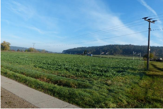
Abbildung 3: Teilfläche A von Süden