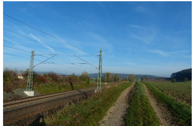
Abbildung 6: Bahn zwischen Teilfläche A und B