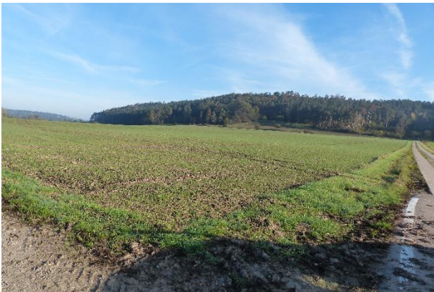
Abbildung 5: Teilfläche B