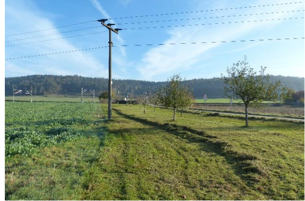
Abbildung 4: Vereinzelte Obstbäume südlich Teilfläche A