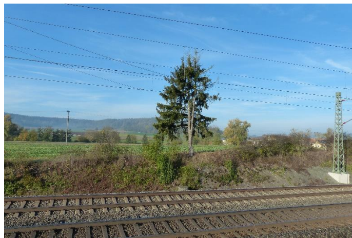
Abbildung 7: Ruderalvegetation entlang der Bahn