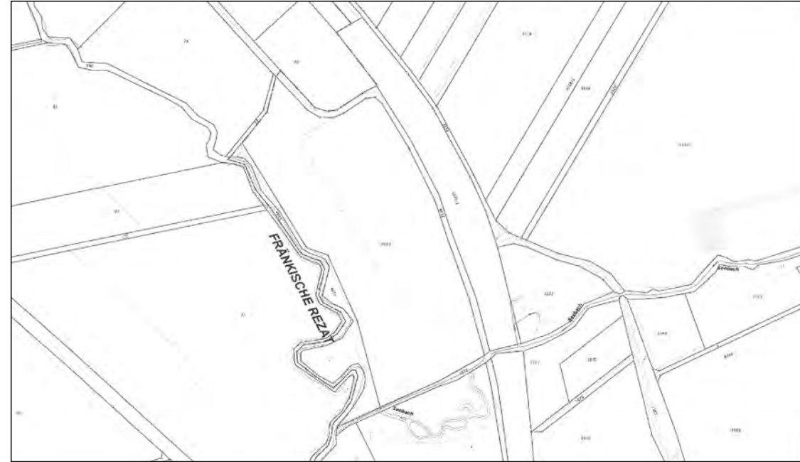
Bestand Maßstab 1 : 5000